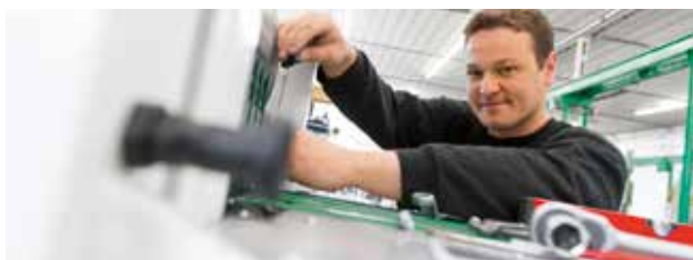
➤ INDUSTRIEMECHANIKER ♂

Speziell haben wir uns der qualitativ hochwertigen Ausbildung verschrieben. Wir stellen uns der Verantwortung und legen größten Wert auf die Vermittlung umfangreichen Fachwissens mit dem Ziel eines erfolgreichen Abschlusses der angestrebten Berufsausbildung. Lass Dich von uns als TOP Ausbildungsbetrieb ausbilden und werde eins mit der Maschine!