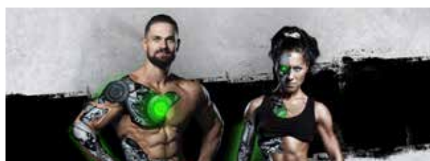
➤ WERDE EINS MIT DER MASCHINE