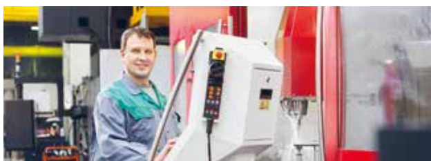
➤ ZERSpanungsmechaniker ♂

Osnabrück – Emsland – Grafschaft Bentheim