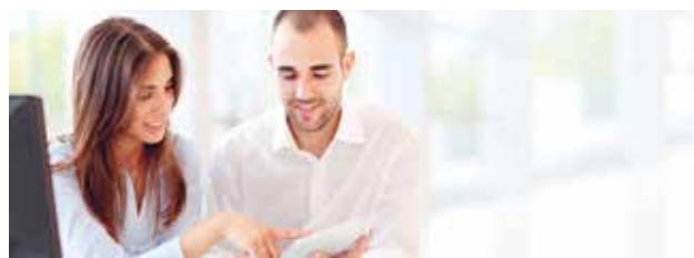
➤ INDUSTRIEKAUFLEUTE ♀