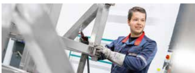
➤ KONSTRUKTIONSMECHANIKER ♀